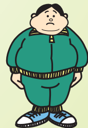
体重が急に減った