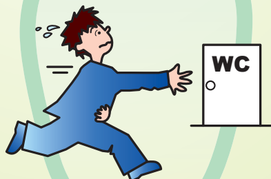
便秘と下痢を繰り返す